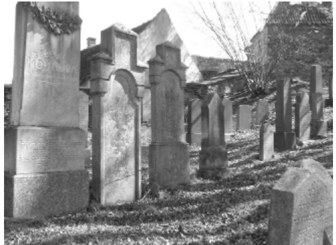
Židovský hřbitov v Bechyni