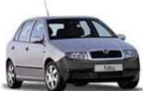
Škoda Fabia Easy Cena od 219.900 Kč Motor 1.2 HTP/40 kW