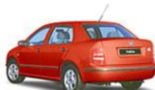
Škoda Fabia Safety Cena od 279.900 Kč Motor 1.2 HTP/40 kW

DALŠÍ SKVĚLÁ AKCE A NABÍDKA - COMBI ZA COMBI!!!