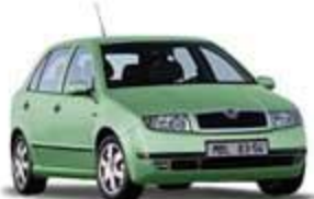
Škoda Fabia Top Cena od 369.900 Kč Motor 1.4 MPI/50 kW