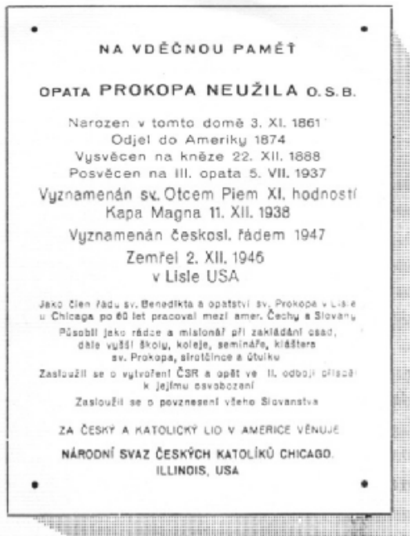
Nápis na pamětní desce rodného domku v Bechyni č. 65 - I.

V březnu roku 1937 byl zvolen opatem českého benediktinského kláštera. Při cestě do Říma, v září 1937 navštívil rodnou Bechyni.