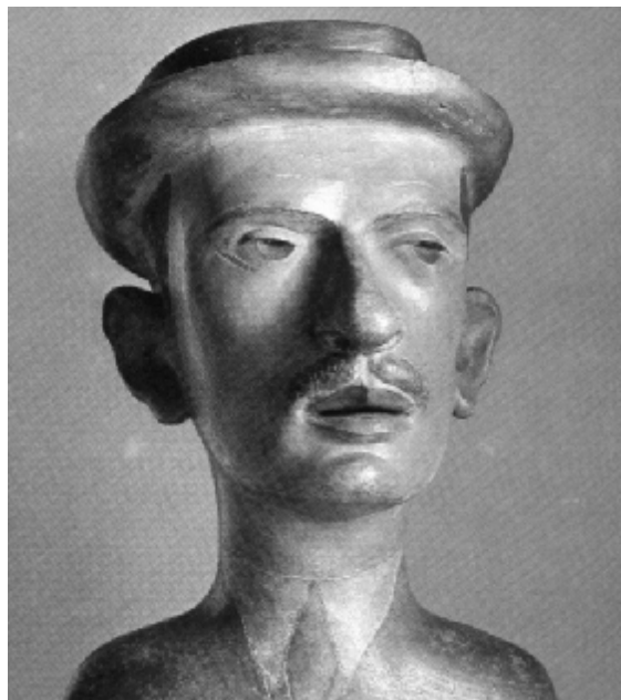
Vlastní podobizna, kolorovaná pálená hlína (1919, v. 45cm, NG)