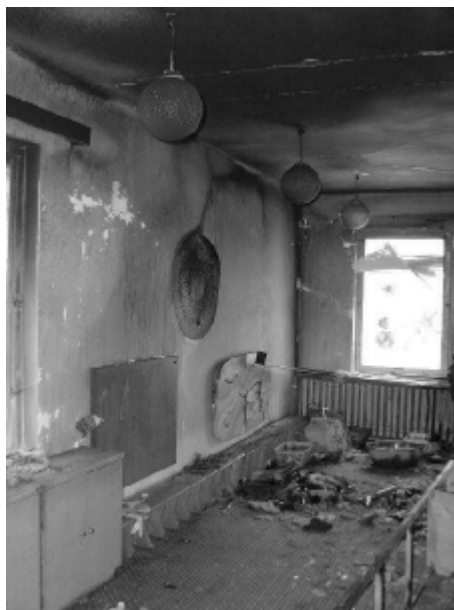
foto: důsledky jednání nezodpovědné osoby