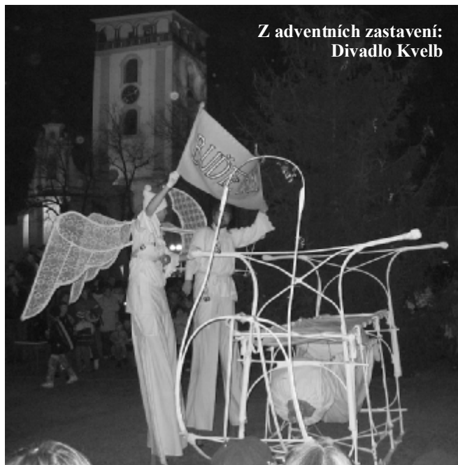
Z adventních zastavení: Divadlo Kvelb